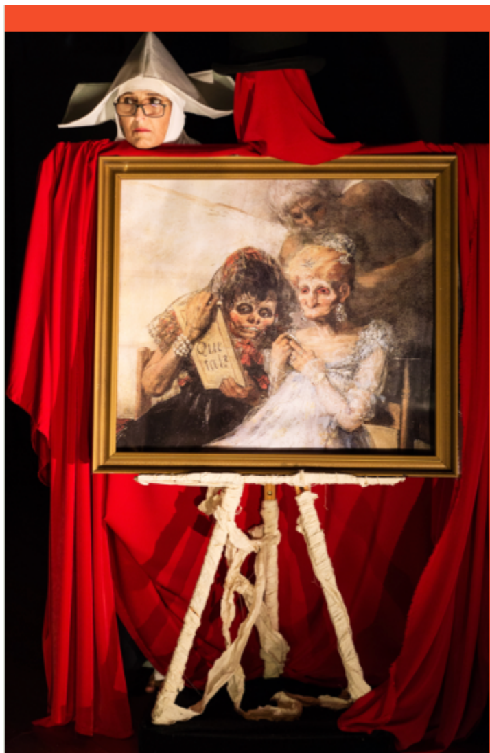
The Deaf Man's House Holstebro, September 2019

Ambientato a Bordeaux, racconta l'ultima notte di vita del pittore Francisco Goya. La sua amante, Leocadia Zorilla, stimola la sua immaginazione e i suoi ricordi. Lo spettacolo esplora gli eventi politici e culturali che hanno influenzato la vita di Goya, come l'Età della Ragione, il Romanticismo, l'Inquisizione e la Rivoluzione Francese. Si focalizza anche sulla sordità totale che ha colpito Goya all'età di 46 anni e sul suo esilio a Bordeaux. Il termine "capriccio" si riferisce al genere artistico che combina elementi fantasiosi e improvvisati, tipici della musica, dell'architettura e della pittura. Nel contesto teatrale, "La casa del sordo – Capriccio su Goya" esplora la vita di Goya attraverso un flusso di immagini, situazioni e pensieri che